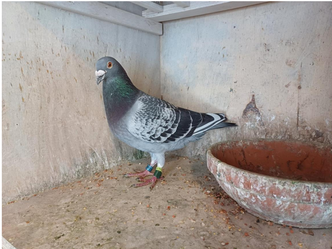
De 21-1222589 "Witte Veder", winnaar Pont st Maxence