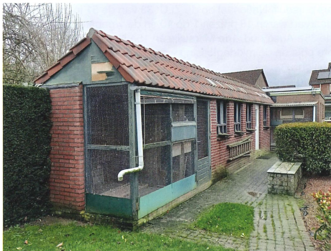
Vooraan zitten de jongen en daarachter de vijf afdelingen voor de weduwnaars.